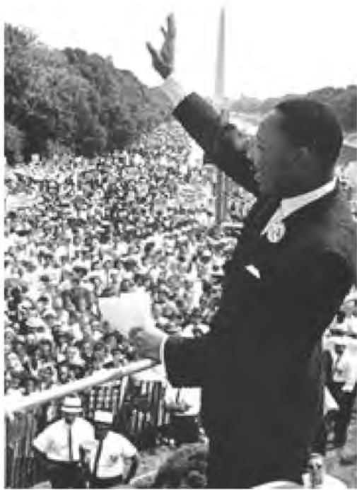
马丁·路德·金在演讲