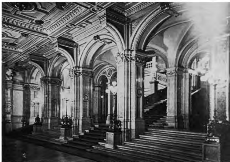
维也纳国家剧院，贝多芬的歌剧《费德里奥》曾在此公演

舒曼 ① 提到《第五交响乐》时也说：“尽管你时常听到它，它对你始终有一股不变的威力，有如自然界的现象，虽然时时发生，总教人充满着恐惧与惊异。”他的密友兴特勒说：“他抓住了大自然的精神。”——这是不错的：贝多芬是自然界的一股力，一种原始的力和大自然其余的部分接战之下，便产生了荷马史诗般的壮观。