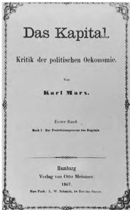
《资本论》第1卷,1867年汉堡第1版

货币所有者只有在市场上找到自由的工人,才能把自己的货币变为资本。所谓“自由的”有两种含义:一是他必须作为自由的人,可以像支配自己的商品一样来支配自己的劳动力;二是他必须没有可以出卖的任何其他商品,没有实际应用他的劳动力所必需的一切东西,也就是说,一贫如洗。自然界既不产生货币和商品的所有者,也不产生除了劳动力而外一无所有的人。这种关系既不是自然界本身所创造的,也不是一切历史时代所共有的社会关系。这种关系是以往的长期历史发展的结果,是许多经济变革的产物,是一系列更古老的社会生产形态死亡的产物。