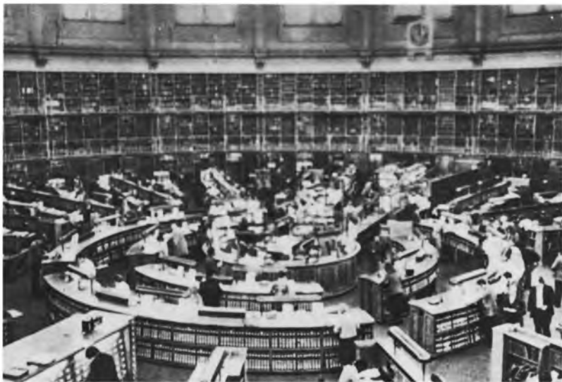
英国博物馆阅览室

资本主义积累的一般规律是:资本的增大包含着它的可变部分即转化为劳动力的部分的增大。如果资本构成保持不变,如果一定量的生产资料经常需要有同量劳动力使之运转,那末显然,劳动力的需求和工人的生活资料基金就会随着资本的增加而增加,而且资本的增加越迅速,它的增加也就越迅速。正像简单的再生产不断再生产着资本主义关系本身一样,资本积累也以更大的规模再生产着资本主义关系。这就是说,在一个极端上再生产着更多的资本家或更大的资本家,在另一极端上就再生产着更多的雇佣工人。因此,资本的积累就是无产阶级的扩大,而且在这种情况下,这种扩大是在对工人最有利的条件下发生的。在工人自己的日益增大的并以日益增长的规模转化为追加资本的剩余产品中,绝大部分都以支付手段的形式流回到他们自己手中,使他们得以扩大自己的消费的范围,并更充裕地筹措衣服、家具等的消费基金。可是,这一切丝毫不会改变工人所处的从属地位,正像丰衣足食的奴隶仍然是奴隶一样。在