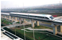
我国首次运行的磁悬浮列车

践中不断遇到的新问题,产生的新要求,推动着人们去进行新的探索和研究,实践的发展为人们提供日益完备的认识工具,这些工具延伸了人类的认识器官,促进人类认识的发展。实践锻炼和提高了人的认识能力,因为人类在改造客观世界的同时,也改造着自己的主观世界,提高自己判断和推理的能力,从而推动认识的不深化。