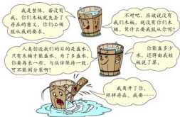
木桶和木板的对话