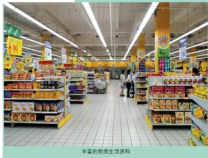
丰富的物质生活资料