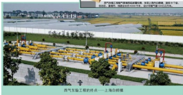
西气东输工程的终点——上海白鹤镇