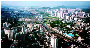
没有创新就没有新城的崛起

迎接未来科学技术的挑战，最重要的是要坚持创新，勇于创新。“科学的本质就是创新”。科学技术的每一进步都是通过创新实现的。科学技术的迅猛发展对人类社会各个方面都产生了深刻而广泛的影响。创新更新了人们的生产工具和生产技术，提高了劳动者的素质，开辟出更广阔的劳动对象，推动了社会生产力的发展。