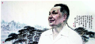
我是中国人民的儿子，我深深地爱着我的祖国和人民

人们站在不同的立场上，就会有不同的价值观，就会作出不同的价值判断和价值选择。我们想事情、做工作，想得对不对，做得好不好，要有一个根本的衡量尺度，这就是人民拥护不拥护，人民赞成不赞成，人民高兴不高兴，人民答应不答应。我们要自觉站在最广大人民的立场上，把人民群众的利益作为最高的价值标准，牢固树立为人民服务的思想，把献身人民的事业、维护人民的利益作为自己最高的价值追求。只有这样，才能保证我们价值判断和价值选择的正确性。