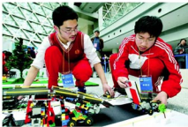
青少年科技创新大赛

辩证法的革命批判精神和创新意识是紧密联系在一起。创新是对既有理论、实践的突破，要创新就要有批判和发展。辩证法的革命精神和批判性思维要求我们，密切关注变化发展着的实际，敢于突破与实际不相符合的成规陈说，敢于破除落后的思想观念，注重研究新情况，善于提出新问题，敢于寻找新思路，确立新观念，开拓新境界。这是我们事业不断取得成功的关键。