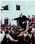
列宁在苏维埃代表大会上

在阶级社会里,社会基本矛盾的解决主要是通过阶级斗争实现的,阶级斗争是推动阶级社会发展的直接动力。被剥削阶级反对剥削阶级的阶级斗争,迫使统治阶级不得不调整某些经济和政治关系,使社会基本矛盾得到一定程度的缓和,从而或多或少地推动了生产力的发展和社会的进步。当旧的生产关系严重阻碍生产力发展时,只有通过先进阶级反对反动阶级的革命,才能推翻反动阶级的统治,建立新的生产关系,解放生产力,推动社会发展。