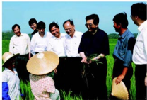
胡锦涛同志在海南海棠工作

坚持群众观点和群众路线，是我们党领导中国人民夺取民主革命胜利的重要保证，也是取得社会主义革命胜利并成功地建设中国特色社会主义的重要保证。