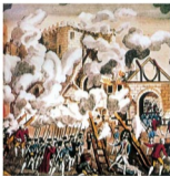
巴黎革命群众攻克巴士底狱

14—16世纪欧洲的文艺复兴运动，是一场反映新兴资产阶级利益和要求的、反封建反神权的思想文化运动，它孕育了一大批思想先锋和文化巨匠，促进了欧洲文化的空前繁荣，为资本主义的发展开辟了道路。