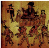
“地狱”的情景也是现实生活的写照