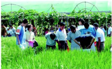
优质水稻吸引了城里人的目光

人的认识是发展的,认识没有终点,科学没有顶峰,任何理论都在不断发展。每个人的知识积累都经历着由不知到知,由知之不多到知之较多的过程,对事物的认识也都有一个由浅入深的过程。