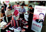
开封市民在翻阅网上展台的《永恒的彩虹》一书