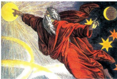
上帝在第四天造出了太阳、月亮和星星

《圣经·旧约·创世记》上说,上帝第一天造出了白天和黑夜,第二天造出了空气和水,第三天造出了各种各样的植物,第四天造出了日月星辰,第五天造出了水中的各种动物,第六天造出了地上的各种生物和人。天地万物都造齐了,第七天就被定为休息日。