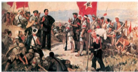
1927年毛泽东在湖南浏阳文家市集合秋收起义的部队（油画）

毛泽东哲学思想是毛泽东思想的重要组成部分。《实践论》、《矛盾论》、《论持久战》、《关于正确处理人民内部矛盾的问题》、《人的正确思想是从哪里来的？》等著作，集中反映了毛泽东哲学思想的主要内容。