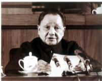
1982年9月1日，邓小平在中国共产党第十二次全国代表大会上致开幕词，明确提出“走自己的路，建设有中国特色的社会主义”

就思想，实事求是；把辩证法应用于当代社会实践，提出了一系列两手抓的思想；把社会基本矛盾理论应用于中国社会主义建设的实践，提出了改革开放的路线、方针和政策，提出了科学技术是第一生产力的论断，提出了“三个有利于”的判断标准。这些都是邓小平哲学思想的重要内容。