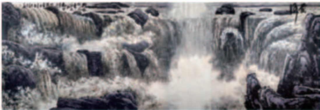
《壶口瀑布》 都本基作

“壶口”。我依在一块大石头上向上游看去，这龙槽顶着宽宽的河面，正好形成一个“丁”字。河水从五百米宽的河道上排排涌来，其势如千军万马，互相挤着、撞着，推推搡搡，前呼后拥，撞向石壁，排排黄浪霎时碎成堆堆白雪。山是青冷的灰，天是寂寂的蓝，宇宙间仿佛只有这水的存在。当河水正这般畅畅快地驰骋着时，突然脚下出现一条四十多米宽的深沟，它们还来不及想一下，便一齐跌了进去，更闹，更挤，更急。沟底飞转着一个个漩涡，当地人说，曾有一头黑猪掉进去，再漂上来时，浑身的毛竟被拔得一根不剩。我听了不觉打了一个寒噤 ① 。