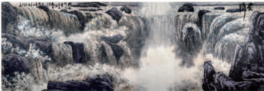
《壶口瀑布》 都本基作

“壶口”。我依在一块大石头上向上游看去，这龙槽顶着宽宽的河面，正好形成一个“丁”字。河水从五百米宽的河道上排排涌来，其势如千军万马，互相挤着、撞着，推推搡搡，前呼后拥，撞向石壁，排排黄浪霎时碎成堆堆白雪。山是青冷的灰，天是寂寂的蓝，宇宙间仿佛只有这水的存在。当河水正这般畅畅快地驰骋着时，突然脚下出现一条四十多米宽的深沟，它们还来不及想一下，便一齐跌了进去，更闹，更挤，更急。沟底飞转着一个个漩涡，当地人说，曾有一头黑猪掉进去，再漂上来时，浑身的毛竟被拔得一根不剩。我听了不觉打了一个寒噤 ① 。